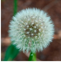
Dant y llew