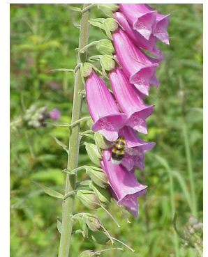
Bysedd y cŵn