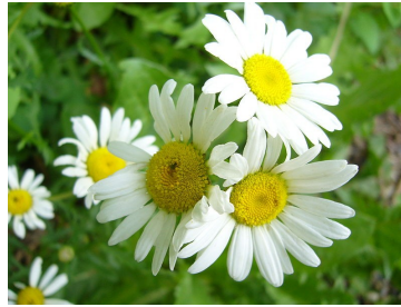
Llygad y dydd